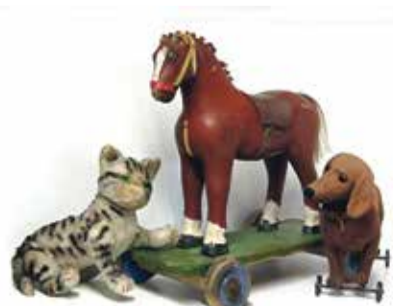
Das Museum beschäftigt sich mit verschiedensten Darstellungen von Spielzeugtieren.

Schon in den ältesten Zeiten der Menschheit hat man für das Kind Tiere nachgebildet, die es in seiner Umgebung erlebte. Mit Kuh, Pferd, Ziege, Schaf und Federvieh machte sich der kleine Bauernbub mit seiner künftigen Tätigkeit vertraut. Obwohl die Technisierung heute vieles verändert hat, ist selbst für Stadtkinder das Spiel mit einem Bauernhof immer noch spannend.