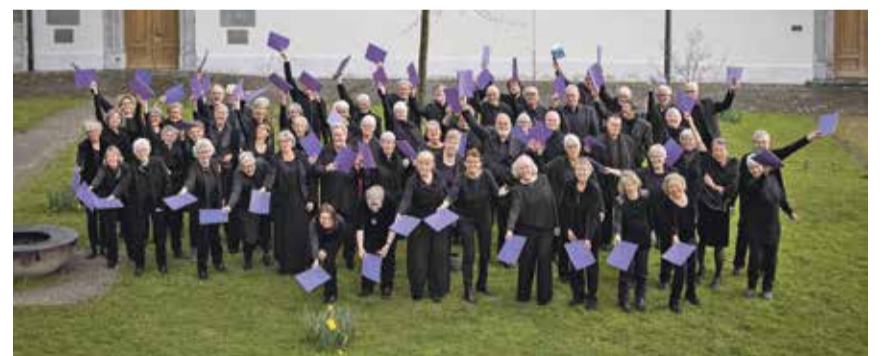
Die Thuner Kantorei wird auch 2026 ihre traditionellen Konzerte zum Palmsonntag aufführen.

Das Museum ist jeweils mittwochs und sonntags von 14 bis 17 Uhr geöffnet. www.spielzeugmuseum-wattenwil.ch